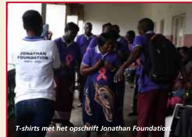
T-shirts met het opschrift Jonathan Foundation.