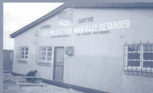
Op de gevel van het nieuwe centrum in Twapia staat zelfs een faxnummer. Niet een eigen fax, maar die van het bisdom...

Zambiaanse zusters hebben in Chingola een gebouwtje naast de kerk beschikbaar gesteld.