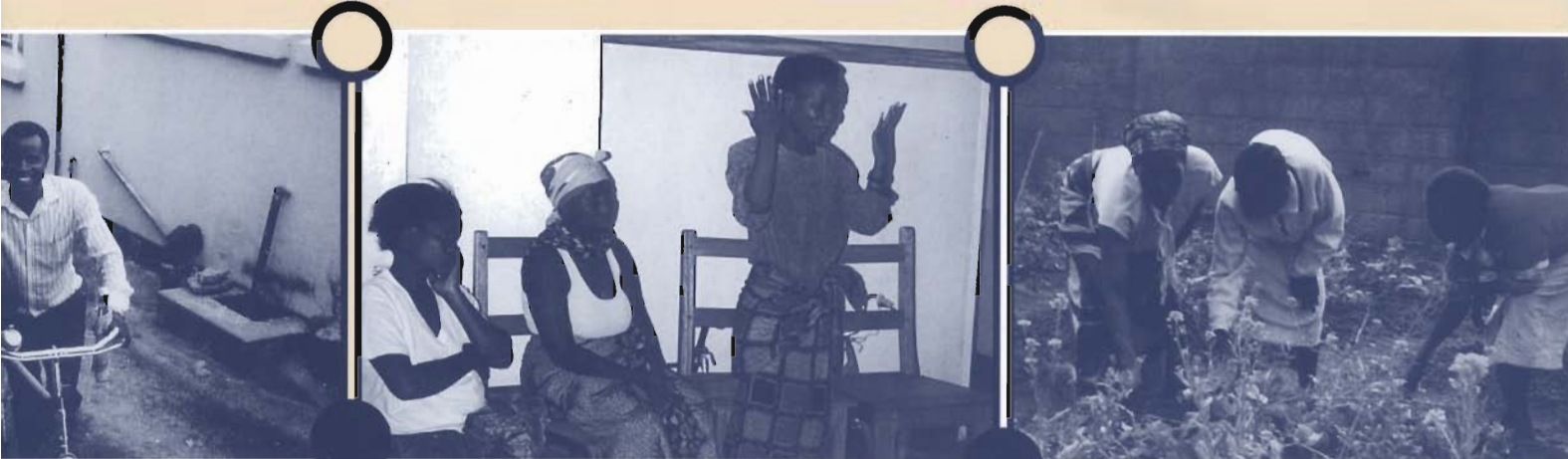
we fiets op huisbezoek.