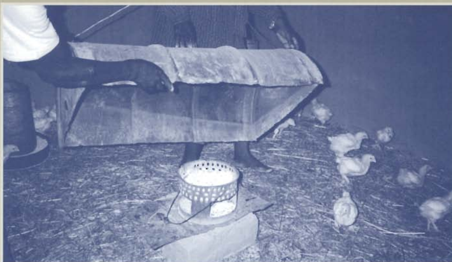
Pilotproject met de kuikentjes

Binnen de diverse centra zijn er nogal wat jeugdigen, die niet in staat zijn een gericht trainingsprogramma c.q. beroepsopleiding te volgen. Men gaat nu onderzoeken hoeveel jeugdigen dit betreft en welke trainingsprogramma's het beste zouden aansluiten op ieders mogelijk-