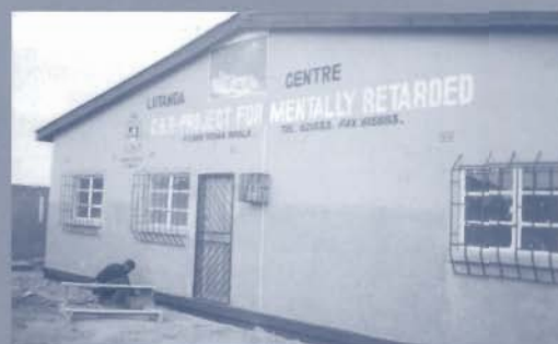
Op de gevel van het nieuwe centrum in Twapia staat zelfs een faxnummer. Niet een eigen fax, maar die van het bisdom...

Zambiaanse zusters hebben in Chingola een gebouwtje naast de kerk beschikbaar gesteld.